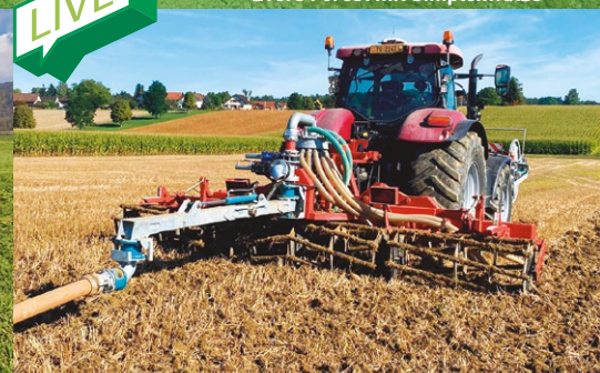
Evers Freiburger Güllegrubber