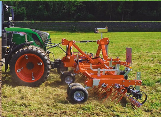
GreenMaster 600 Alpin