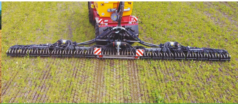
Evers Quadro Disc