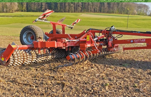
GüttlerMaster 640 mit Flat Spring Board