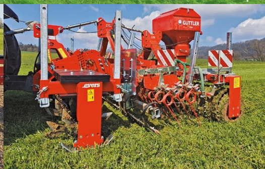
Evers Grasnarbenbelüfter & GreenMaster als Heckkombination