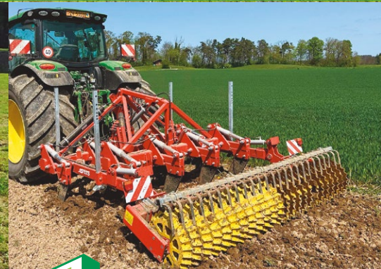
Evers Forest mit Simplexwalze