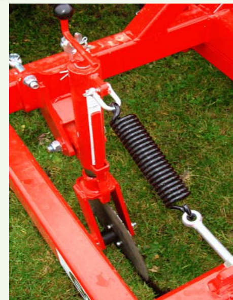
Standaard met spindelverstelling