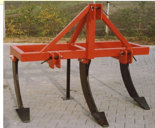
Met St tanden en beitel 15cm

4 types tanden nl. St, K, KG en MT. Voor een uitgebreidere informatie vraag naar de technische omschrijving. Tegen meerprijs ook tanden beschikbaar geheel uit Hardox -staal. Denk aan situaties met veel stenen e.d. (MT tand standaard in Hardox -staal).