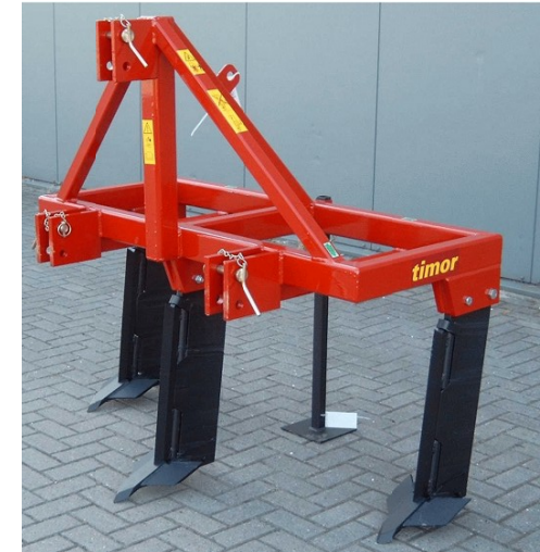
Met MT tanden

Ook leverbaar met afwijkende tandafstanden. Denk hierbij aan spoorbreedte van de trekker. Hierover kunt U contact opnemen.