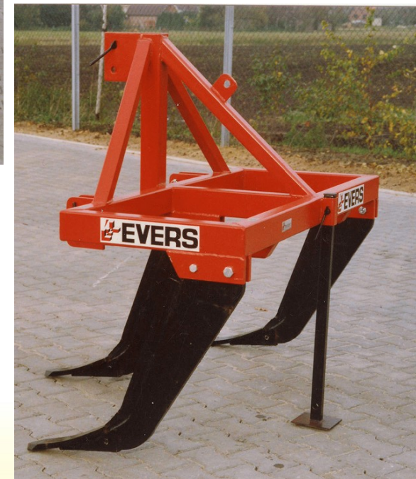
Met K tanden en beitels 6cm