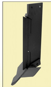
MT tand Beitel 25 cm